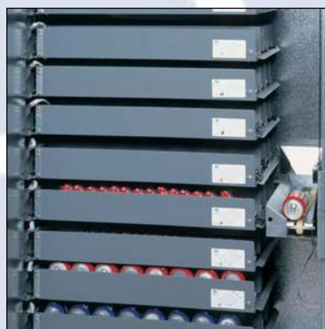
Ascensor entrega productos sin golpes

Ahora en Oferta 7.995 € (IVA no incluido)